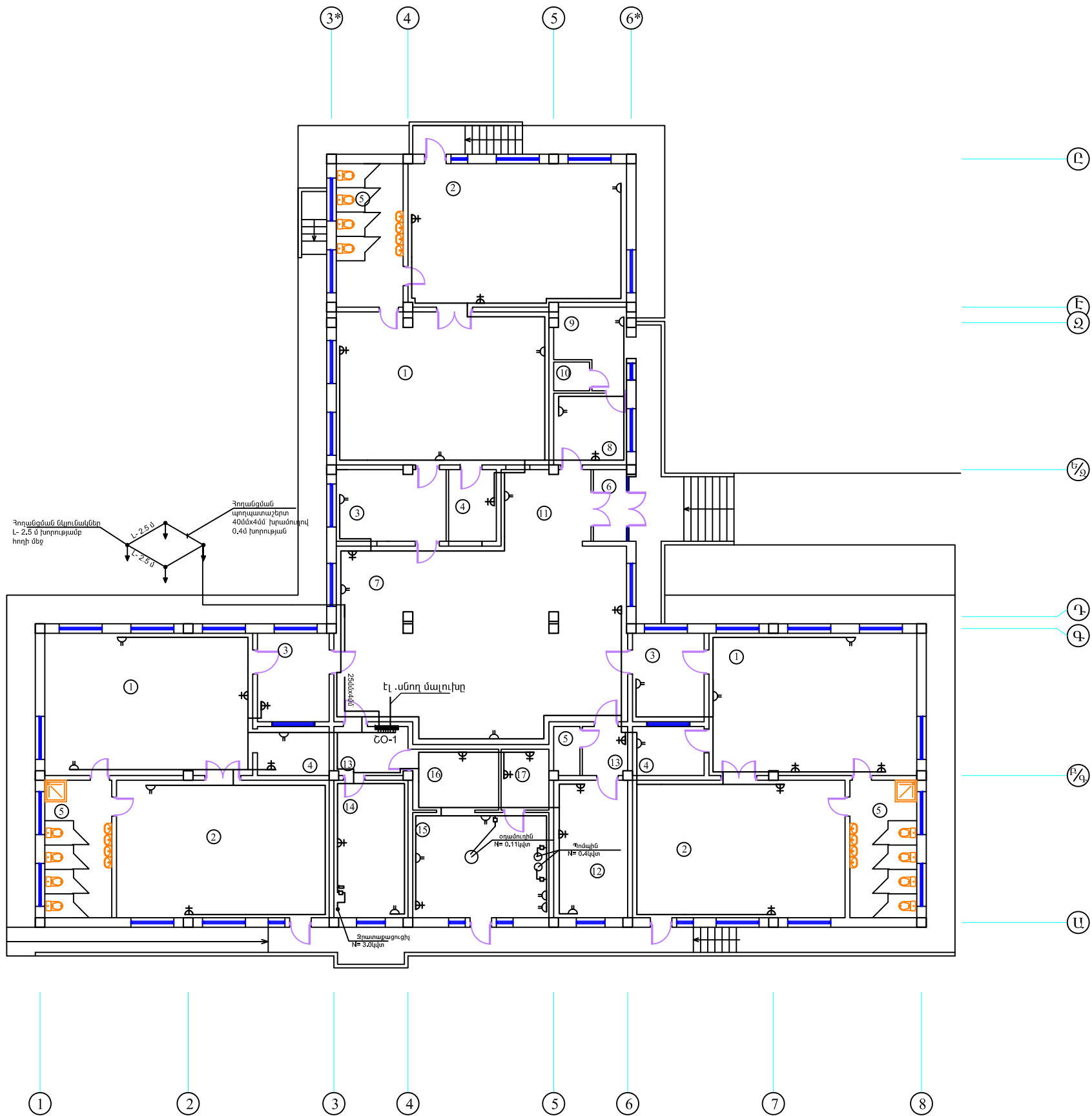
ՆԱԽԱԳԾԻ ՀԻՄՆԱԿԱՆ ՑՈՒՑԱՆԻՇՆԵՐ